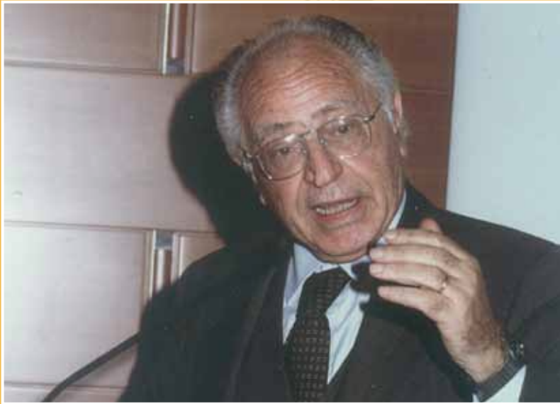
1999 - "Le Regioni nel l'ordinamento federale della Repubblica", convegno alla presenza del ministro Antonio Maccanico.