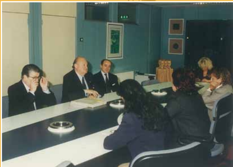
1995 - L'ambasciatore Usa in Italia in visita all'Assemblea regionale dell'Emilia-Romagna.