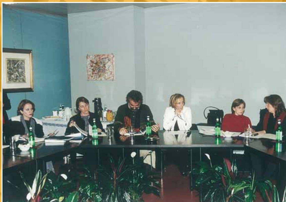
1999 - Incontro con una delegazione di donne del bacino del Mediterraneo.