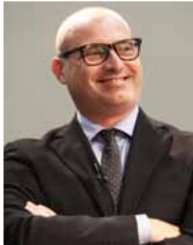
Stefano Bonaccini (Pd) Presidente