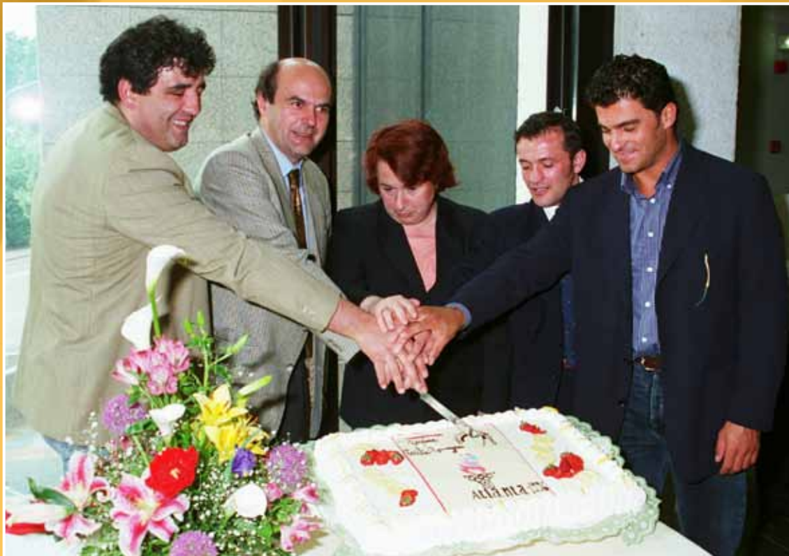
1996 - Il Presidente della Giunta Pierluigi Bersani con Alberto Tomba in occasione dei festeggiamenti per i giochi olimpici di Atlanta.