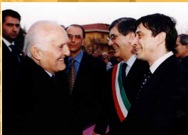
1999 - Il Presidente della Giunta regionale Vasco Errani insieme al Presidente della Repubblica Oscar Luigi Scalfaro a Forlì.