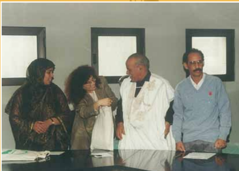
1996 - I consiglieri regionali incontrano una delegazione del popolo Saharawi.