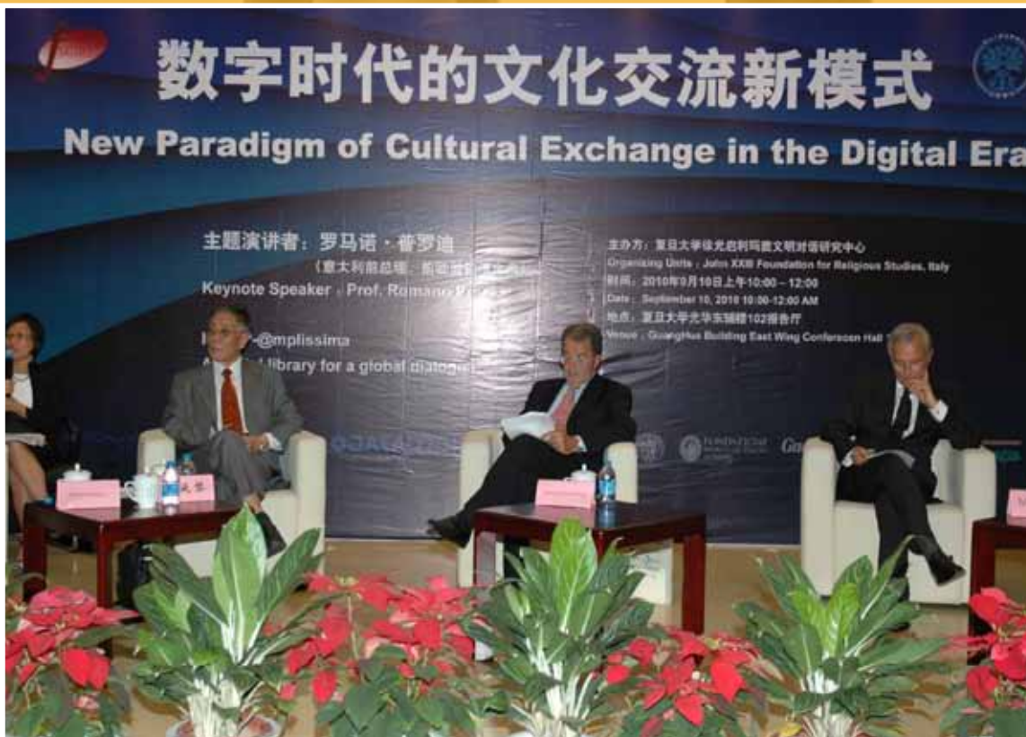
2010 - L'ex premier Romano Prodi interviene all'Expo di Shanghai, durante le settimane dedicate all'Emilia Romagna.