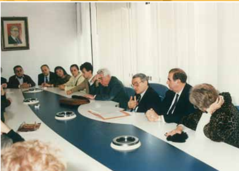
1990 - I consiglieri regionali dell'Emilia-Romagna incontrano i famigliari degli italiani ostaggi in Iraq durante la prima Guerra del Golfo.