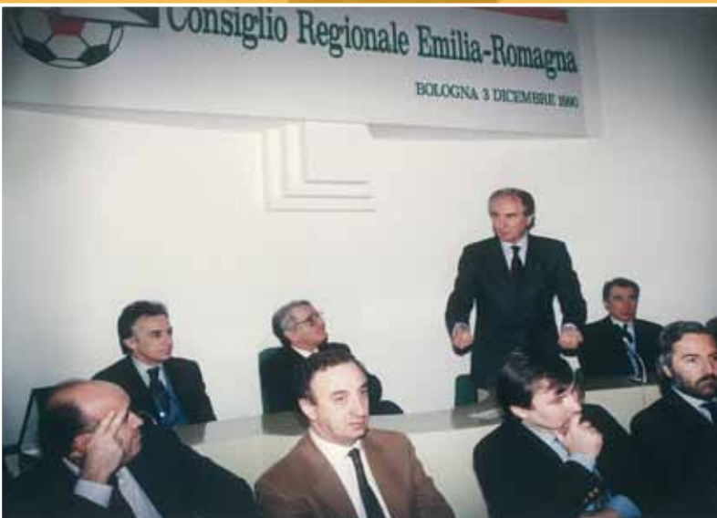
1990 - Premiazione dei calciatori della nazionale italiana in occasione del Mondiale Italia '90, in primo piano il commissario tecnico azzurro Azeglio Vicini.