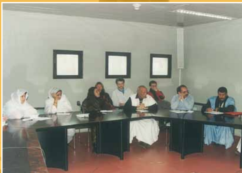
1996 - Una delegazione del popolo Saharawi ospite dell'Assemblea legislativa regionale.