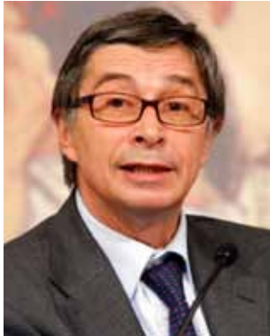
Vasco Errani (Pd) Presidente