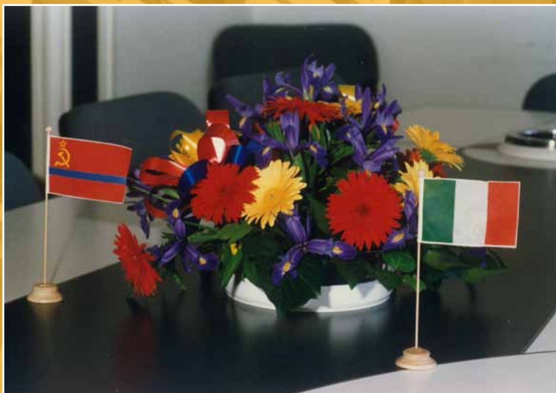
1989 - Visita in Consiglio regionale di una delegazione della Repubblica Armeno-Sovietica (Urss).