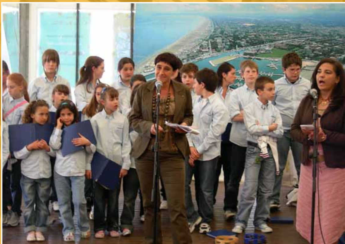
2008 - La Presidente dell'Assemblea legislativa Monica Donini a Rimini in occasione del meeting dei giovani europei promosso dall'Assemblea regionale dell'Emilia-Romagna.