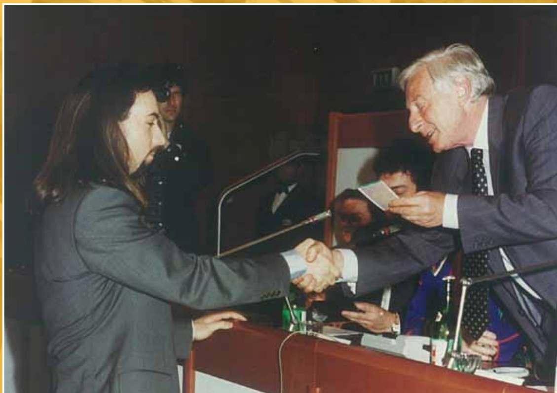
1994 - La premiazione dei giovani vincitori del progetto contro il razzismo "Passaporto europeo".