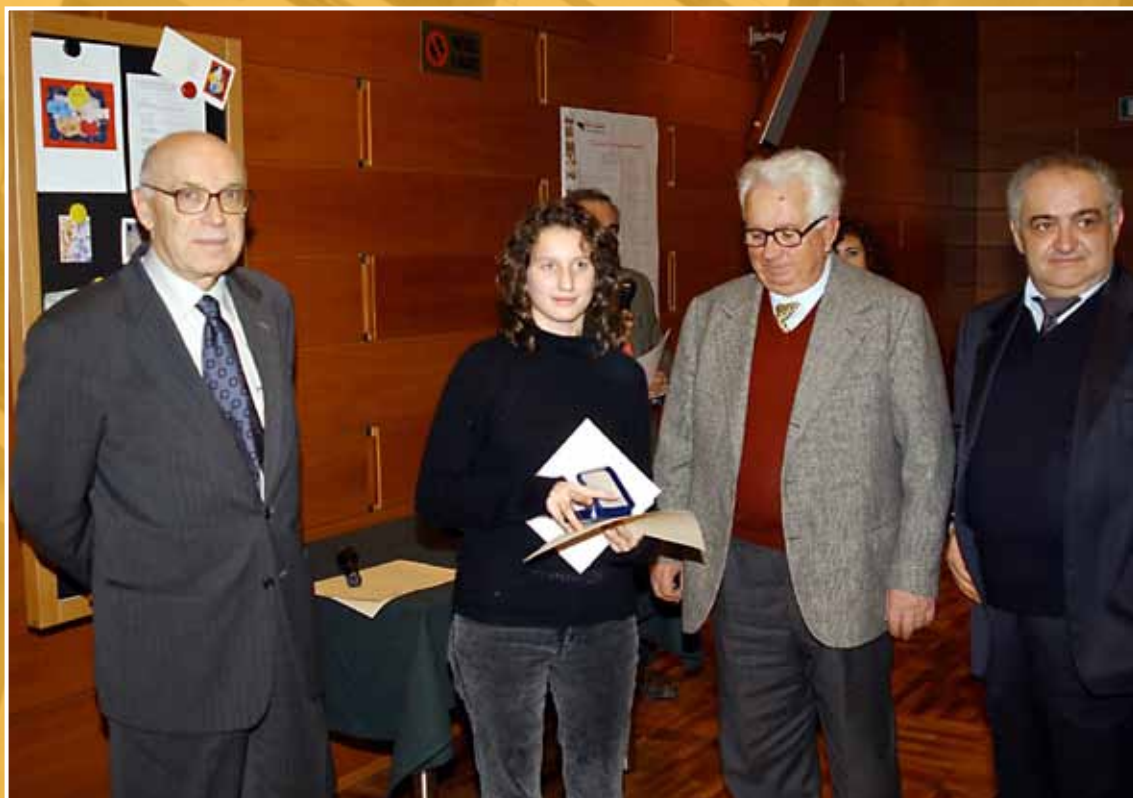
2003 - Il Presidente dell'Assemblea legislativa Antonio La Forgia con studenti e reduci dai campi di sterminio in occasione della celebrazione del Giorno della Memoria.