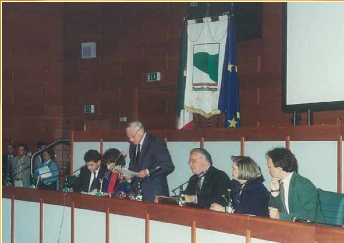
1992 - Il Consiglio regionale apre le porte ai giovani, intervento di saluto del Presidente Federico Castellucci.