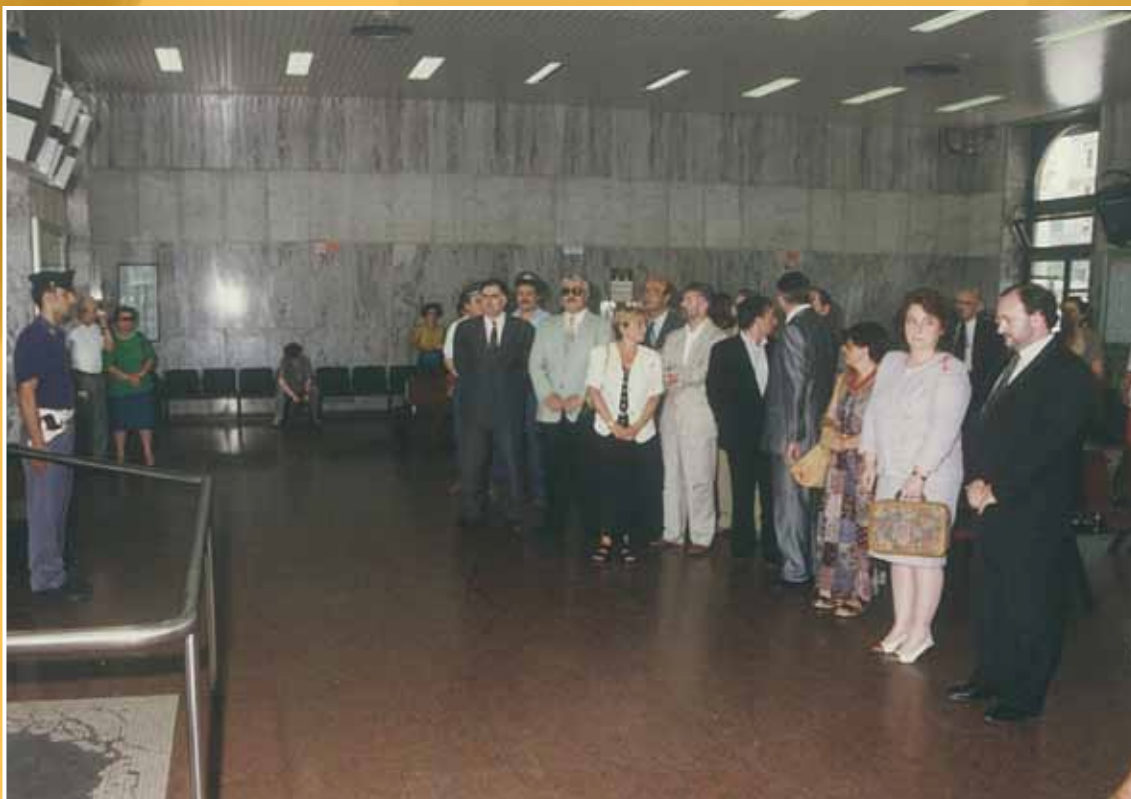
1995 - Una delegazione del Consiglio regionale depone una corona di fiori nell' atrio della stazione di Bologna in occasione della commemorazione della strage del 2 agosto