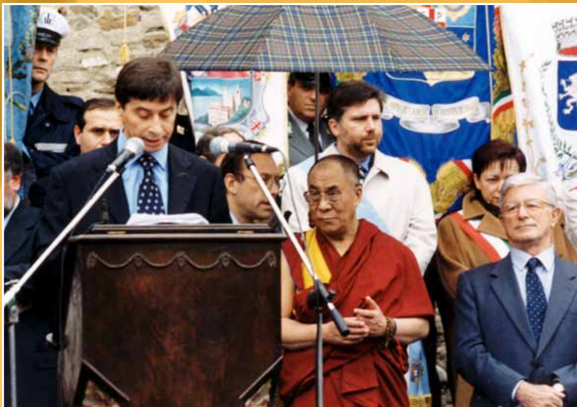
1999 - Vasco Errani, Presidente della Giunta regionale, saluta il Dalai Lama in visita alla Casa del Tibet di Votigno.