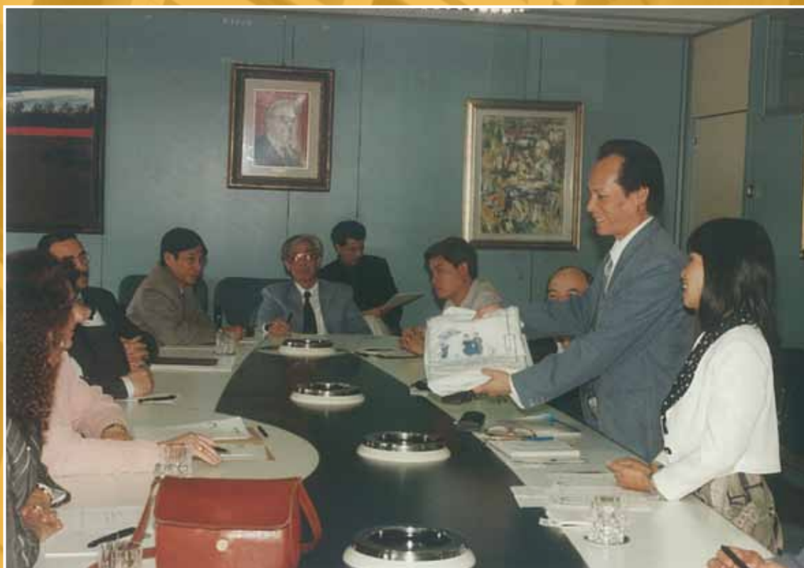
1995 - Visita di una delegazione del Vietnam.