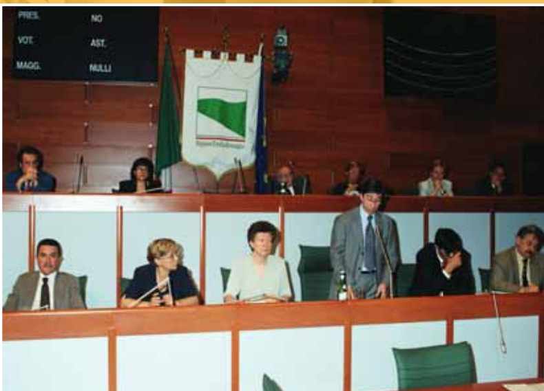
2000 - Insediamento della nuova Giunta Errani.