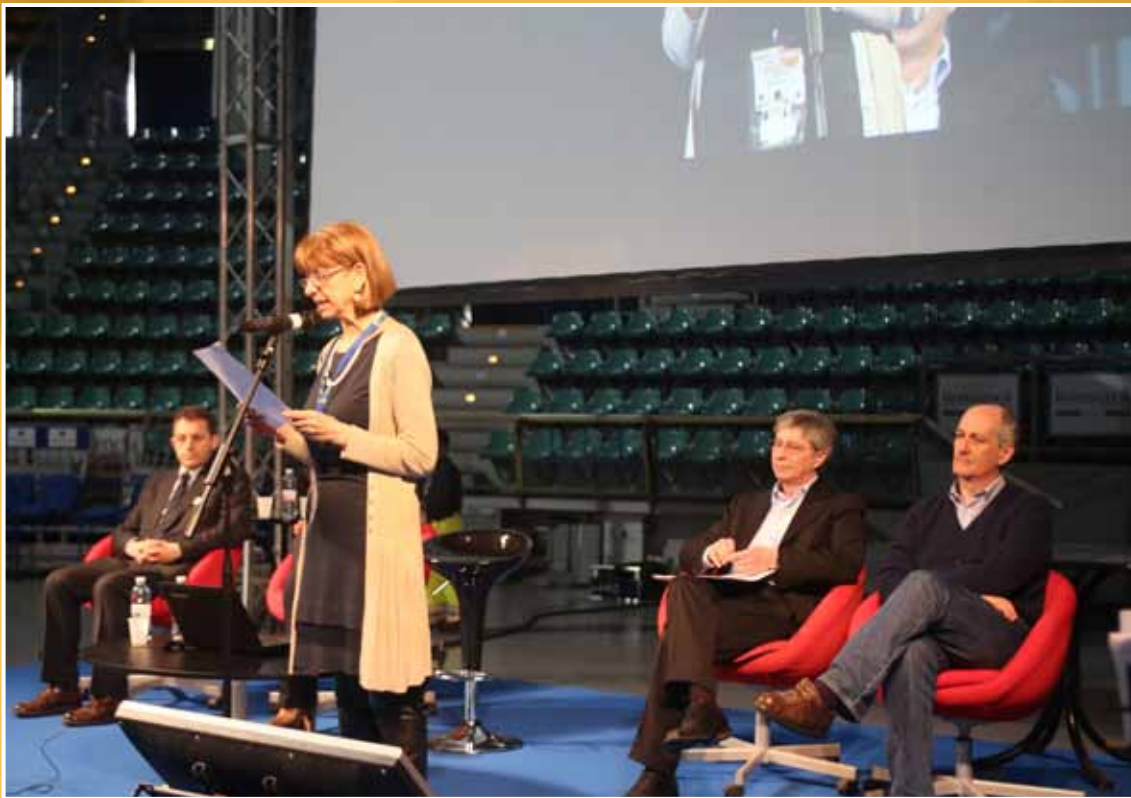
2013 - A un anno dal sisma giornata di ringraziamento per i volontari che operano nelle zone del sisma, l'intervento del Presidente dell'Assemblea legislativa Palma Costi.