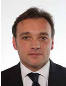
Matteo Richetti (Pd) Presidente dal maggio 2010 al dicembre 2012