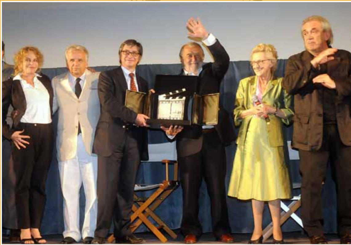
2009 - Il Presidente della Giunta regionale Vasco Errani, premia il regista Pupi Avati per i 40 anni di attività artistica.