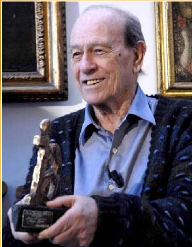
2008 - Il giornalista Giorgio Bocca riceve il Premio Ilaria Alpi alla carriera.