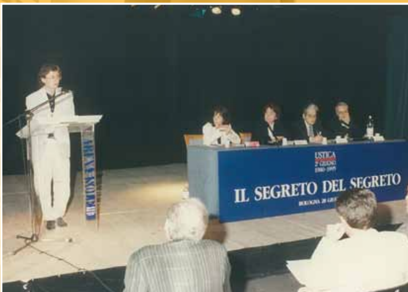
1995 - Gli interventi al Convegno per la verità su Ustica.