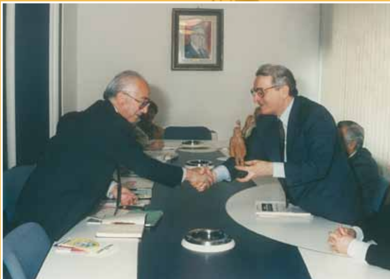
1990 - Delegazione messicana in visita al Consiglio regionale.