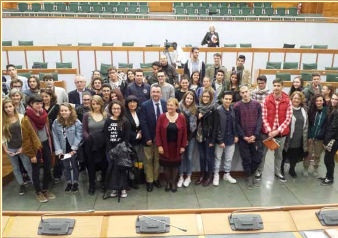
2014 - L'Emilia-Romagna dice no alla mafia: studenti accolti in Assemblea all'interno del progetto "Concittadini".